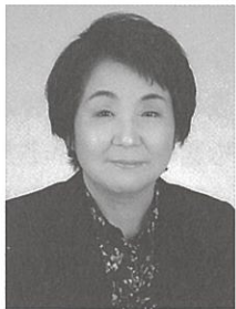
〈聞き手・構成〉 ジャーナリスト 塚崎 朝子

「健康を失ってみて、健康であることすら意識せず送ってきた平凡な日常が、いかにありがたかったか。縁あって知り合った人には、病気も含めてつらい思いをせず幸せになってほしい」。心の底からそう願う。65歳になり、「自分の時間を大切にしながら、患者に還元する日々を続けたい」(敬称略)