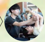
栄養カウンセリング & パーソナルトレーニング